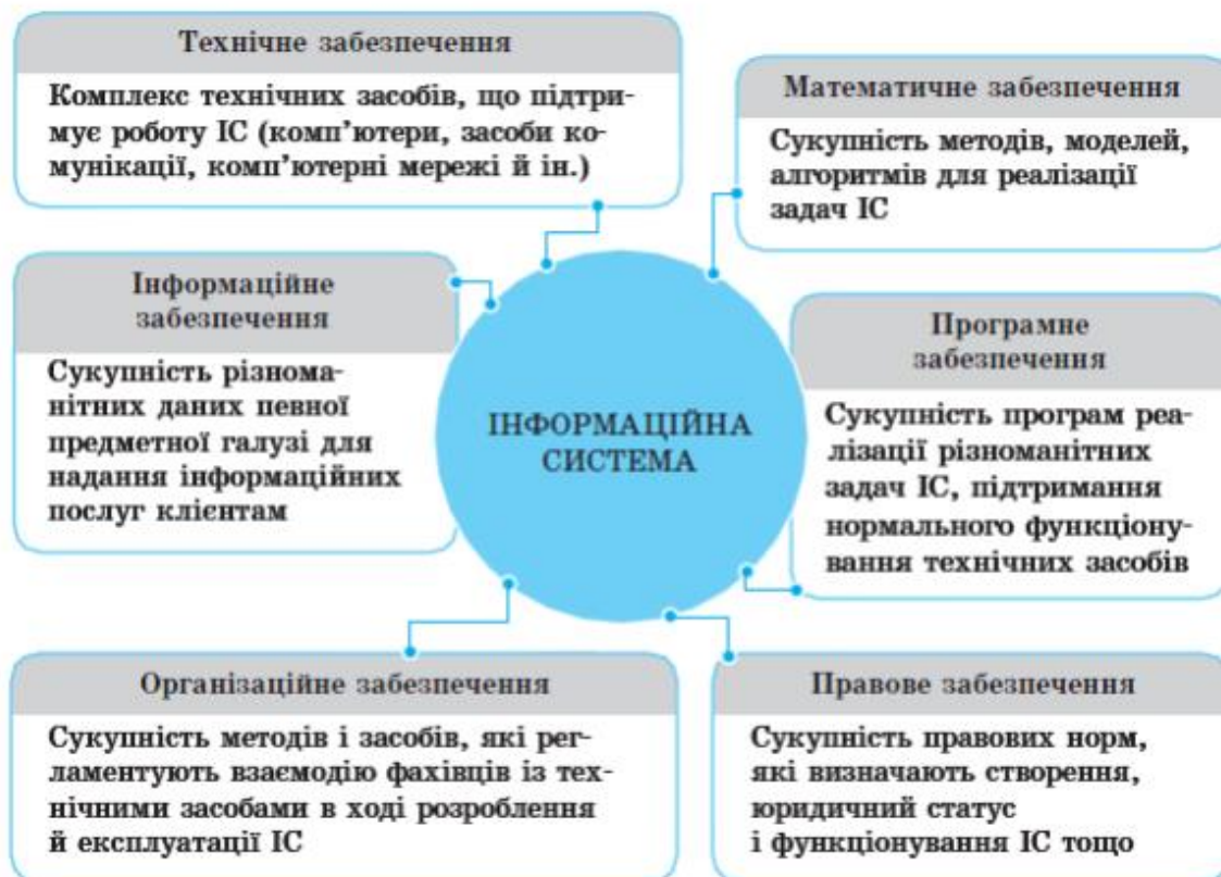
Рис. 3.1. Інформаційна система підприємства

Таблиці нумерують послідовно (за винятком таблиць, поданих у додатках) у межах розділу. У правому верхньому куті над відповідним заголовком таблиці розміщують напис «Таблиця» із зазначенням її номера. Номер таблиці повинен складатися з номера розділу і порядкового номера таблиці, між якими ставлять крапку, наприклад: «Таблиця 3.1» (перша таблиця третього розділу).